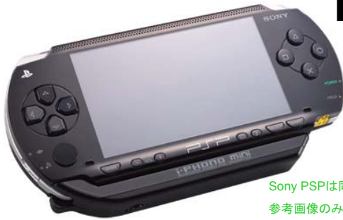
Sony PSPは同梱しておりません。 参考画像のみ